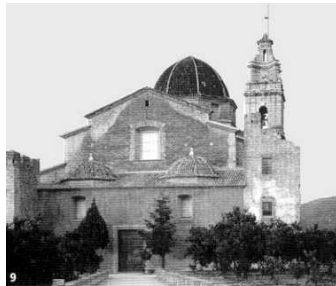
FRONTERA DE L'IGLESIA