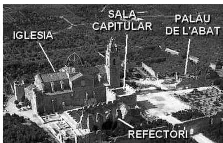
IMAGE DEL CONJUNT MONACAL ABANS DE LES OBRES DE RESTAURACIO

En 1991 la Generalitat Valenciana adquirí el monasteri i s'iniciaren les actuacions per a la seua recuperació. Junts en els treballs de reposició del claustre, s'han portat a terme les obres de reconstrucció de la sala capitular i la restauració de la mih-rab de la mesquita, que s'alça junt al temple cristià. L'any 1998 fon declarat Be d'Interés Cultural .