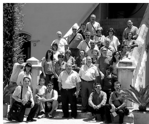
PART DELS EXCURSIONISTES EN EL PALAU DUCAL

El passat 14 de juny, socis i amics del Rogle participarem en una excursio-visita a la Safor. Visitarem els monasteris de St. Jeroni de Cotalba i de Sta. M a de la Valldigna (dels quals es fa resenya en este numero), a mes de la ciutat de Gandia.