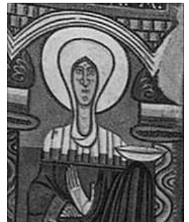
MARE DE DEU DE SANT CLEMENT DE TAHÜLL