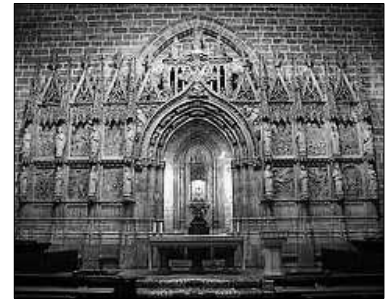
AULA CAPÍTULAR DE LA SEU DE VALENCIA

Des de que el Sant Calic se conserva en Valencia, dos son les vegades en que ha tingut que abandonar la Seu degut al